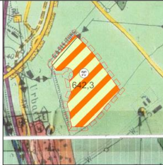
16. Änderung des Flächennutzungsplanes im Bereich des vorhabenbezogenen Bebauungsplanes "Agri-Solarpark Sankt Josef", Gemarkung Mittelurbach