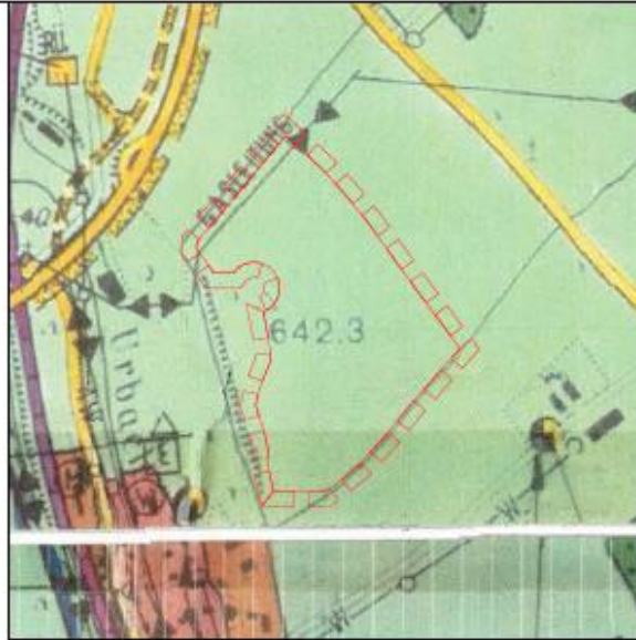
Stand vor der Änderung des Flächennutzungsplanes