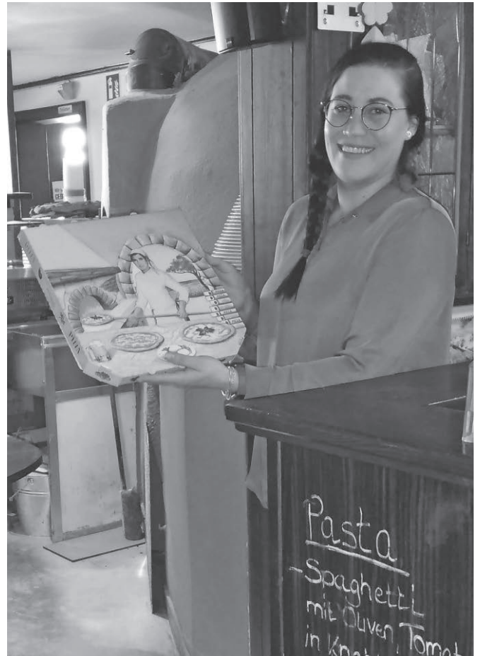
Restaurant Viva bietet auch weiterhin Speisen zum Mitnehmen oder bringt diese nach Hause