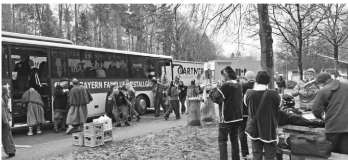
Partystimmung am Parkplatz

Am Gumpigen Donnerstag zogen wir in Bergatreute durch die Lokale und Geschäfte. Die spürbare Begeisterung der Mäschkerle gab uns Schwung für die weiteren Stationen. Am Fasnetsonntag begleiteten wir den Umzug in Bergatreute musikalisch durch die Straßen, ehe wir am Dienstag in Saulgau unseren letzten Fasnetsumzug bewältigten. Neben unseren musikalischen Einlagen in den Lokalen rundete ein zufälliges Zusammentreffen mit Saulgaus Bürgermeister Osmakowski-Miller (auch Ehrenzunftmeister) und einem daraus resultierenden „Witze-Wettstreit“ die Stimmung ab. Mit 10 Auftrittstagen haben wir eine tolle Fasnet erlebt. Vielen Dank allen Unterstützern und Zuhörern. Auch nächstes Jahre schlägt unser Herz wieder für die Fasnet.