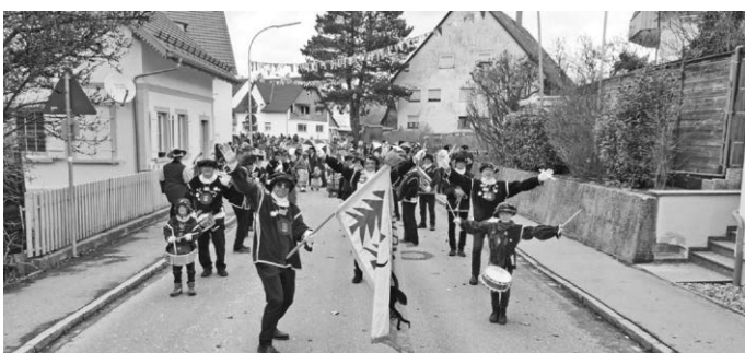
Fasnetsonntag in Bergatreute