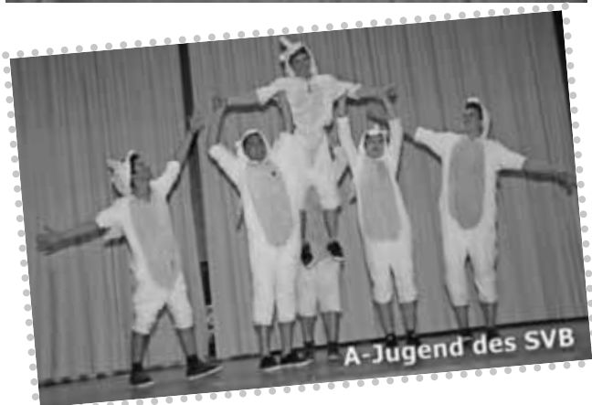
A-Jugend des SVB